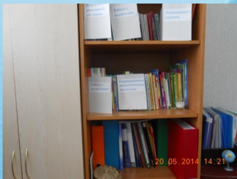
Шкаф для книг, Методических пособий