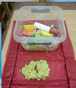
Зона песка и воды