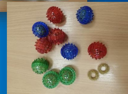
Зона для развития тактильного, кинетического восприятия, мелкой моторики