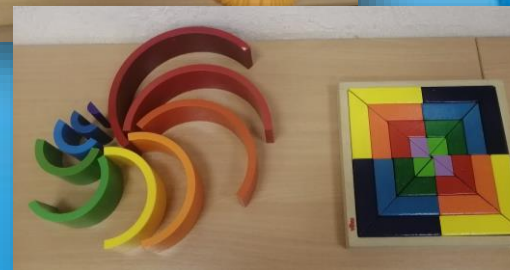
Зона для игр на сенсорное восприятие